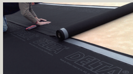
Winddicht verklebt mit der beidseitig integrierten Verklebung.