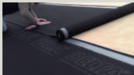
Collage des recouvrements avec les deux bords autocollants intégrés