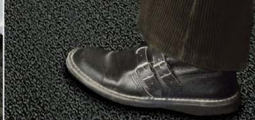
Nopovaná struktura: bezpečná chůze, neklouže.