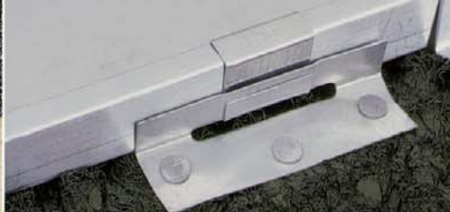
Umožňuje dilatování plechových pásů.