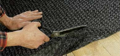
Jednoduchá a rychlá pokládka.