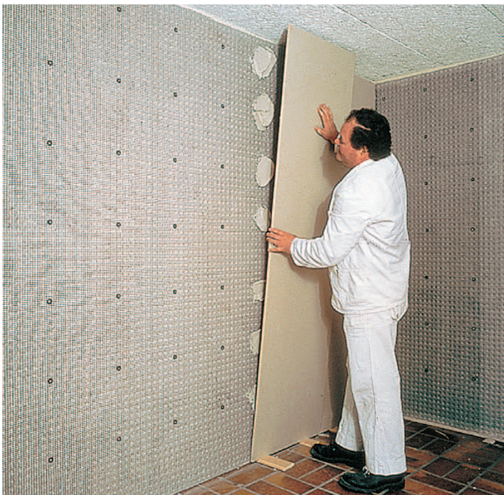
A DELTA®-PT szilárd alapot képez gipsz és mészcement vakolatok vagy gipszkartonlapok számára.