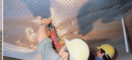
Könnyen rögzíthető a falon.