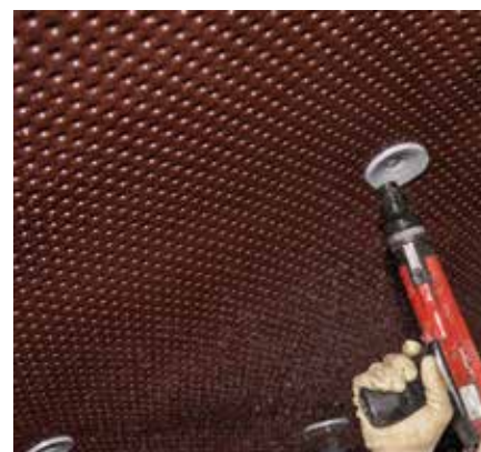
Мембрана DELTA®-AT 1200 устанавливается на торкретбетон.