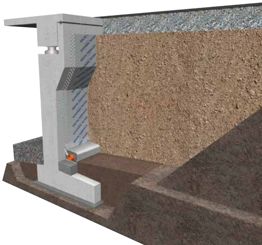
Опоры моста: надёжная защита от воздействия воды.

скую защиту гидроизоляционного слоя, то достаточно использовать профилированную мембрану DELTA®-MS, которая успешно применяется по всему миру с 1979 года, или новую нашу разработку – мембрану DELTA®-MS 1000, обладающую очень высокой прочностью на сжатие. Наши дренажные и защитные мембраны использовались при строительстве транспортных развязок на МКАД, Третьем транспортном кольце (Москва), Волоколамском и Ленинградском шоссе и других объектах.