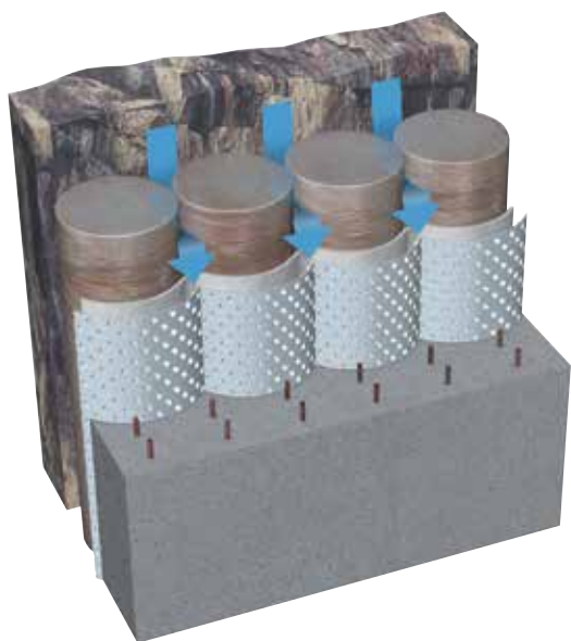
DELTA®-TERRAXX, конструкция стены в грунте из буронабивных свай.

Высокопрофильная мембрана DELTA®-MS 20 обладает очень большой водопропускной способностью при вертикальной установке (10 л/с*м) благодаря выступам высотой 20 мм. У стандартной мембраны DELTA®-MS с выступами высотой 8 мм водопропускная способность равна 2,25 л/с*м.