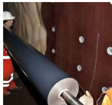
Монтаж гидроизоляционной мембраны поверх DELTA®-AT 1200.