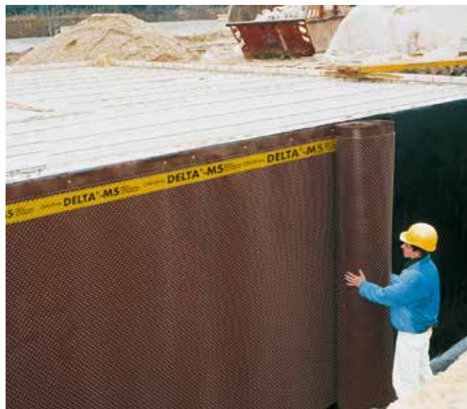
DELTA®-MS, защита гидроизоляции.