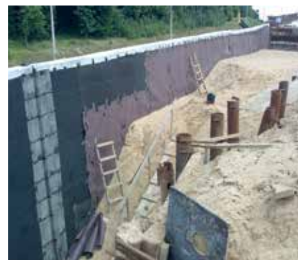
DELTA®-MS при строительстве эстакад на развязке МКАД-Ново-Рижское шоссе.