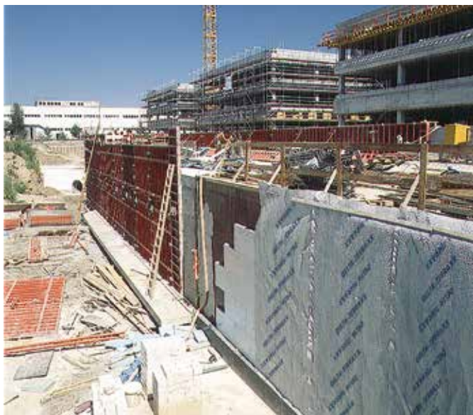
DELTA®-TERRAXX, защитный и дренажный слой.

Выступы мембраны, расположенные к грунту, образуют дренирующий слой, который простирается по всей поверхности подземного сооружения. Напаянный слой из термоскрепленного геотекстиля защищает профилированную структуру от заиливания мелкими фракциями грунта.