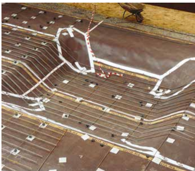
DELTA®-MS, строительство ТРЦ Павелецкий, Москва.

Мембраны DELTA®-MS и DELTA®-NB нашли широкое применение в России при строительстве животноводческих комплексов, что позволило инвесторам значительно снизить стоимость строительства.