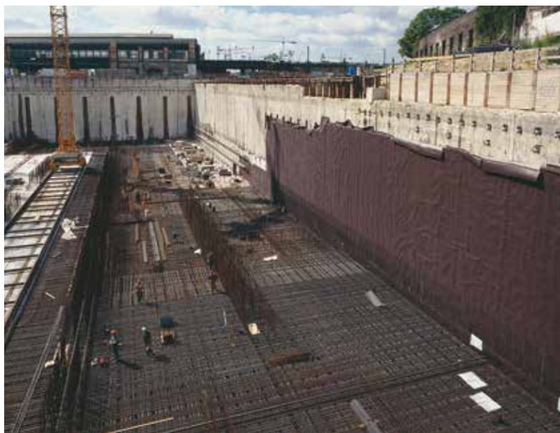
DELTA®-MS при строительстве станции метро в Дуйсбурге.