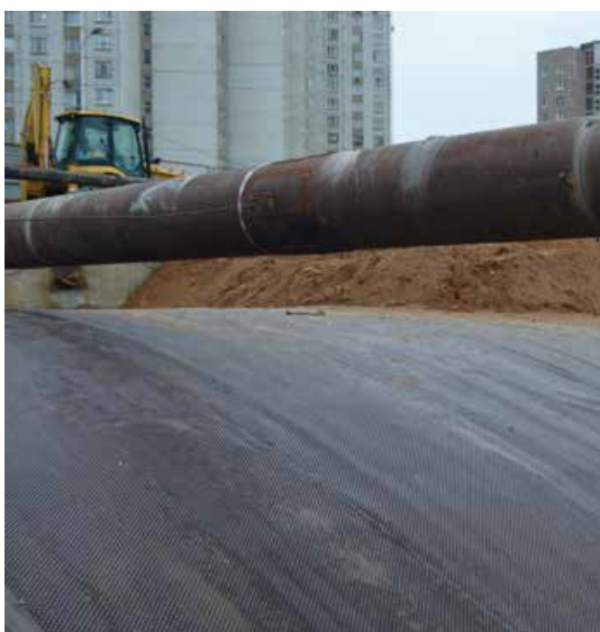
Московский метрополитен, станция «Лермонтовский проспект», DELTA®-AT 800.

Для ремонта старых тоннелей нами разработана мембрана DELTA®-PT с интегрированной сеткой, на которую наносится слой торкретбетона.