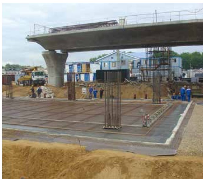
DELTA®-MS при строительстве а/п Внуково.